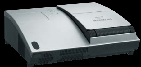
超短投写距離フロントプロジェクター CP-A100J

CP-A100Jの設置距離は、77型のインタラクティブ・ホワイトボードからわずか20cm弱。この距離でボードいっぱいに映像を映すことが可能で、プロジェクターを取り付けるアームの長さも短くすることができました。しかもコンパクトで重量は5.8kgと軽量なので、強度不安も解消され、ボードとプロジェクターがセットされている状態でスライドできます。プロジェクターの位置合わせが不要で投写している映像ごと上下にボードを動かしてプレゼンターの身長に合わせられ、とても便利です。また左右にもスライドできるので映像を投写しながらのプレゼンテーションのスペースを十分とることができ、見やすい位置に固定できます。ボードの近くから投写するため、プレゼンターの影や、ボードに書き込む際の手先の影の映り込みも少なく、快適にプレゼンテーションできるようになりました。